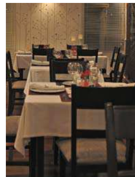
Detalle del nuevo comedor

Este nuevo comedor dará servicio también para comidas y cenas de empresa y celebraciones especiales. Este cambio se une a la remodelación de la terraza que todos los clientes de El Plantío han podido disfrutar durante el verano.