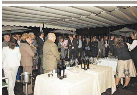
Numeroso público acudió al acto y a la cata de vinos