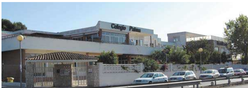
Imagen de las instalaciones de Colegio Palma, en la urbanización de Montecañada